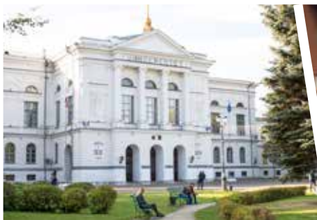
Томский государственный университет

Программа профессиональной переподготовки, дающая возможность руководителям и специалистам совершенствовать свои знания в сфере агробизнеса