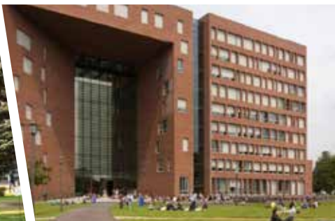
Университет Вагенингена (Нидерланды)